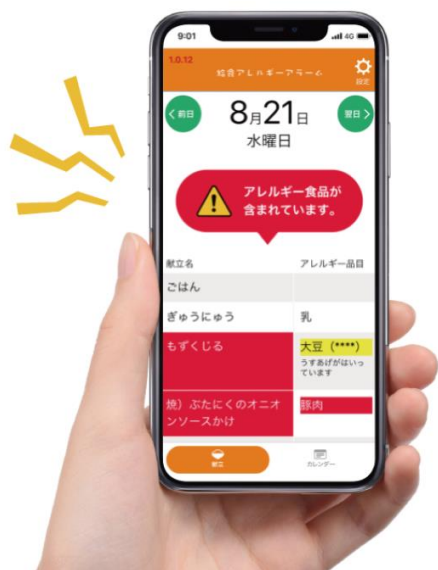
スマートフォンアプリ